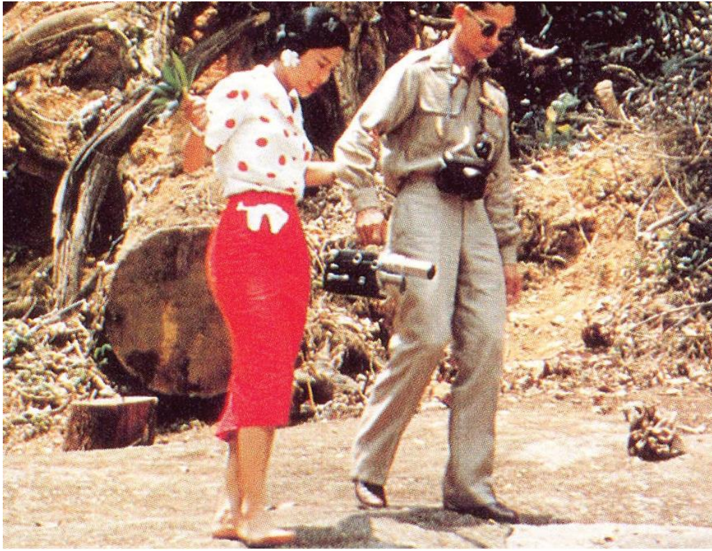
เสด็จพระราชดำเนินที่น้ำตกพรหมโลก (๑๕ มีนาคม ๒๕๐๒)