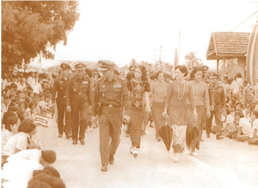
เสด็จพระราชดำเนินลงแพขนานยนต์ข้ามแม่น้ำปากพนัง ไปฝั่งตะวันออก (๓ กันยายน ๒๕๑๘)