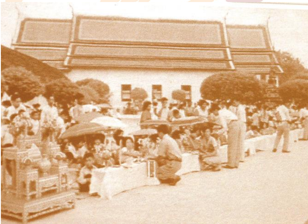
ชาวนครพากันมาเฝ้ารับเสด็จที่วัดพระมหาธาตุวรมหาวิหาร (๑๕ มีนาคม ๒๕๐๒)