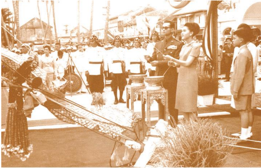
เสด็จยกช่อฟ้าอุโบสถใหม่ของวัดวังตะวันตก (๒๖ พฤษภาคม ๒๕๐๗)