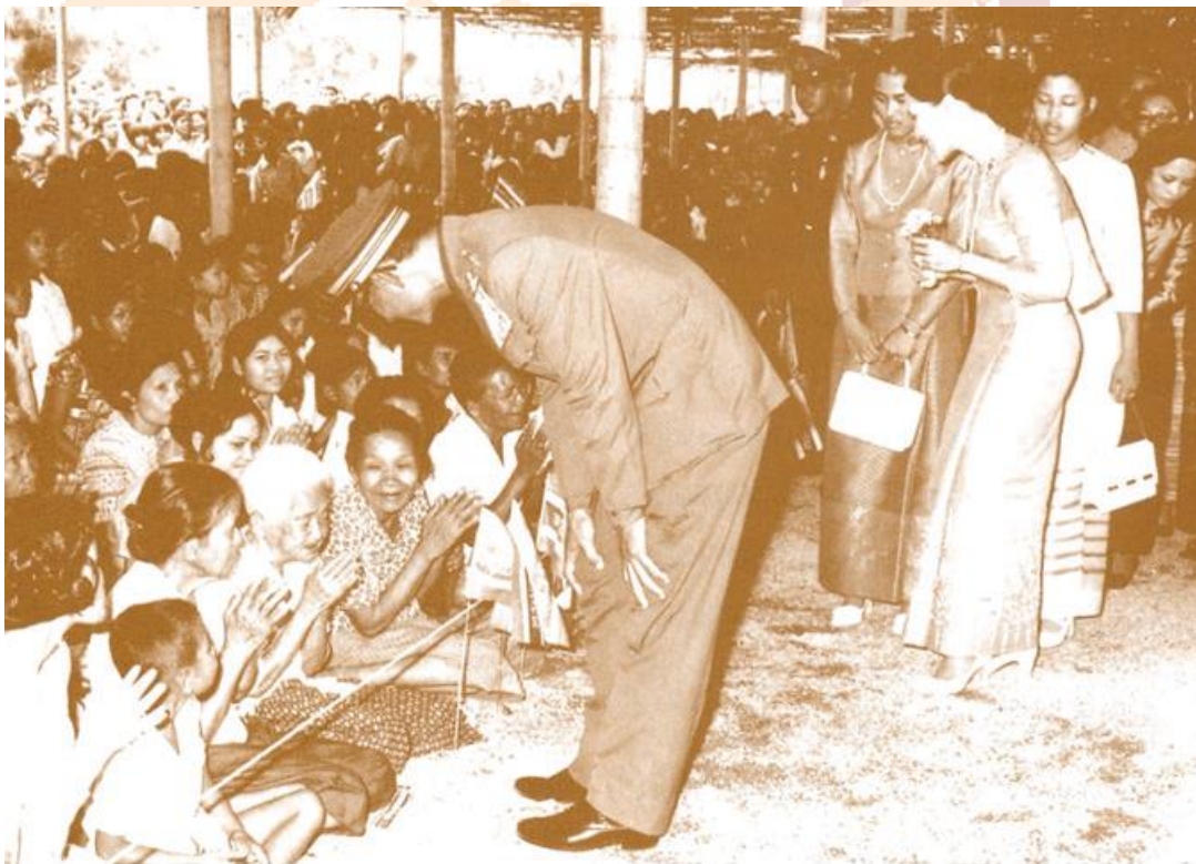
ทรงพระราชปฏิสันถารกับหญิงชราอายุ ๙๗ ปี (๒๙ เมษายน ๒๕๑๖)