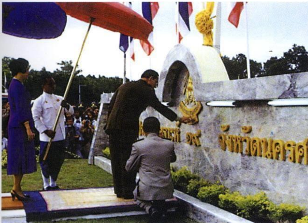
พระบาทสมเด็จพระเจ้าอยู่หัวพร้อมด้วยสมเด็จพระนางเจ้าฯ พระบรมราชินีนาถ เสด็จพระราชดำเนินไปทรงเปิดโรงเรียนราชประชานุเคราะห์ ๑๘ ที่ตำบลหนองหงส์ อำเภอทุ่งสง จังหวัดนครศรีธรรมราช เมื่อวันที่ ๓๐ กันยายน พุทธศักราช ๒๕๑๓