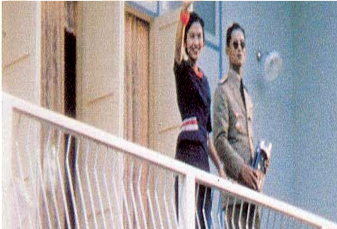
ทรงถ่ายภาพและโบกพระหัตถ์ขณะประทับที่ระเบียงในจวนผู้ว่าราชการ จังหวัดนครศรีธรรมราช (๑๓ มีนาคม ๒๕๐๒)