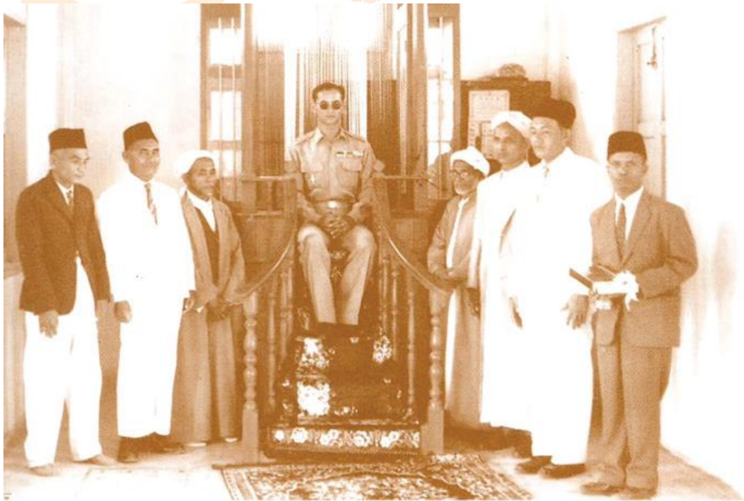
ทรงประทับนั่งในมัสยิดชอลาฮุดดีน (๑๕ มีนาคม ๒๕๐๒)